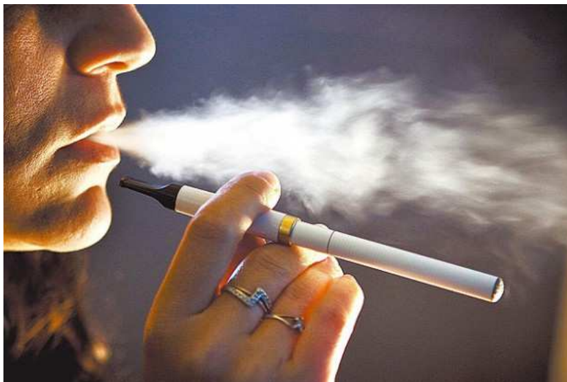
Fumante experimenta cigarro eletrônico.

Contrariando conclusões da própria literatura científica médica, um grupo de otorrinolaringologistas testemunhou em favor da indústria do tabaco em nove processos judiciais entre 2009 e 2014, na Flórida, nos Estados Unidos, alegando que o uso de cigarros não foi causa de câncer de fumantes autores das ações, concluiu um estudo da Universidade Stanford publicado em 17 de julho no periódico "Laryngoscope".